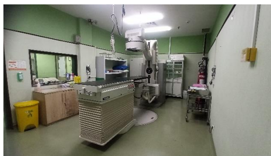
Gambar 3. Pesawat Simulator