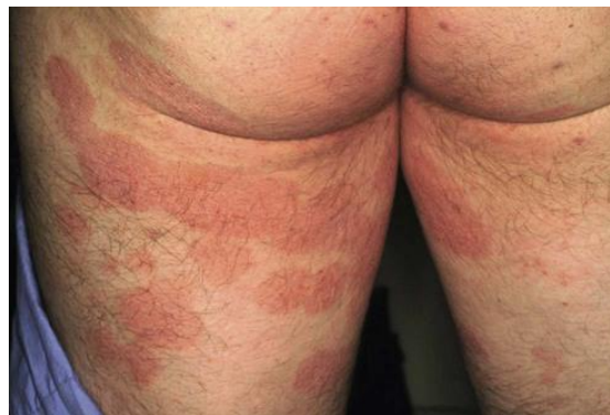
Gambar 2. Mycosis Fungoides

Gambaran histologic yang semula tampak sebagai dermatitis kronik sebenarnya hanya menjadi jelas dalam keadaan yang telah lanjut, sitofotometri DNA dan mikroskopi electron membantu pada diagnostic. Terapi mycosis fungoides mengenai lesi permulaan, terdiri dari PUVA (Psoralen+UV-A) atau UV-B. 13,14 Penyinaran electron seluruh kulit tubuh memberi hasil yang baik, terutama pada stadium dini. Pengusapan kulit dengan larutan nitrogen mustard ternyata juga efektif. Pada stadium lanjut kombinasi kemoterapi dapat memberi remisi yang lama dan baik. 10