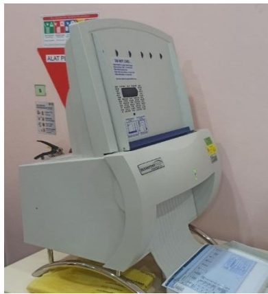
Gambar 6. Alat Scan Radiograf