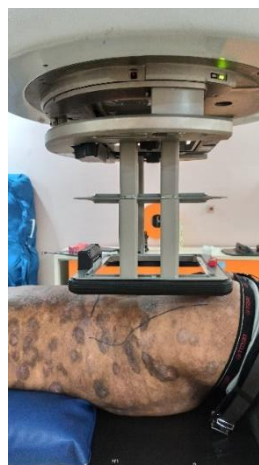
Gambar 9. Pasien dengan aplikator