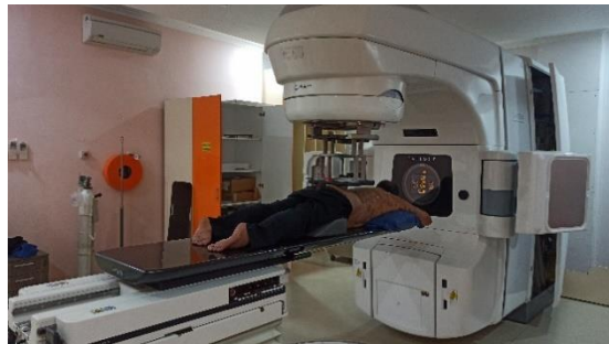
Gambar 8. Posisi Pasien Prone