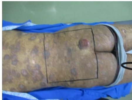
Gambar 4. Gambar Lapangan Penyinaran